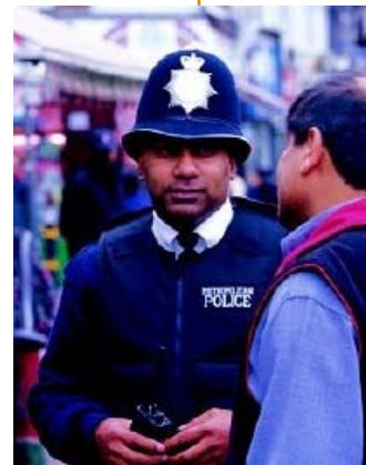
Syr Ronnie Flanagan GBE QPM

Dylid dehongli'r adroddiad fel adroddiad interim i raddau helaeth iawn. Er fy mod yn fodlon â'r ymateb helaeth i'n cais cyhoeddedig am gyfraniadau at yr Adolygiad, mae llawer i'w wneud eto. Rwy'n arbennig o awyddus i ymgymryd â gwaith ymgynghori cyhoeddus ehangach o lawer wrth i'r gwaith fynd rhagddo. Mawr yw fy nyled i lawer o'r bobl a sefydliadau am roi gymaint o'u hamser a'u hymdrech i mi yn y gwaith hwn, a byddant wrth gwrs yn cael cydnabyddiaeth briodol yn yr adroddiad terfynol y gobeithiaf ei gyflwyno'n gynnar y flwyddyn nesaf.